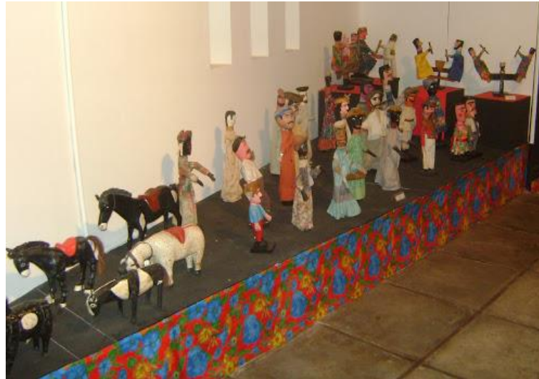
Figura 8. Representação dos personagens humanos e animais.