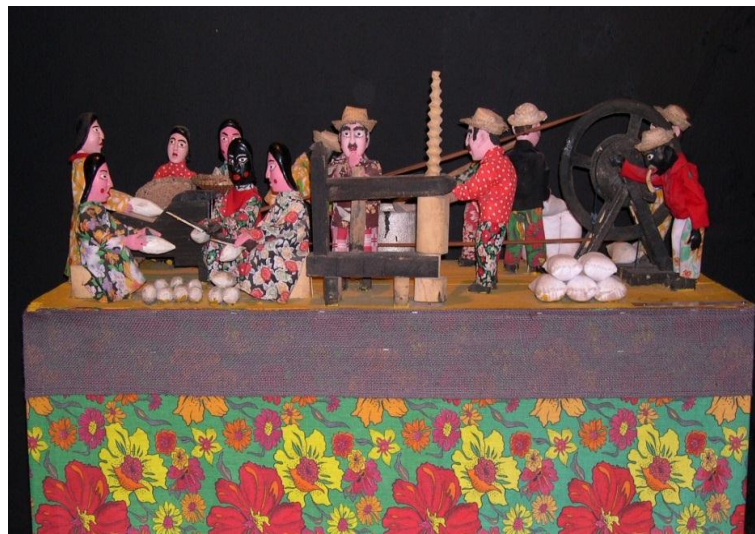
Figura 7. Casa-de-farinha de Saúba.

Como vemos na figura 7, os bonecos mecânicos são fixados a uma base de madeira. O movimento é realizado por meio de um sistema de fios e roldanas. Essas engenhocas contêm elementos de cenário que dão maior realismo e contexto para os movimentos dos bonecos, retratando personagens e cenas do cotidiano rural ou acontecimentos históricos, remetendo ao modelo utilizado pelos frades franciscanos no período colonial.