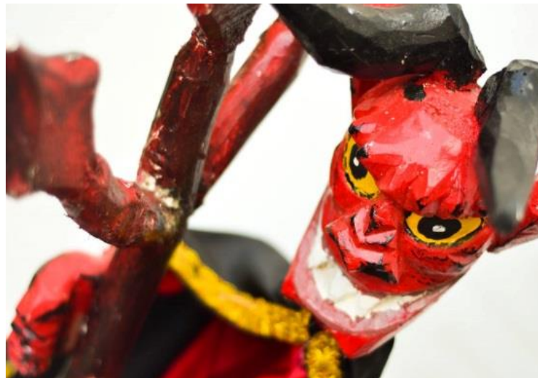
Figura 9. Representação do ser sobrenatural.