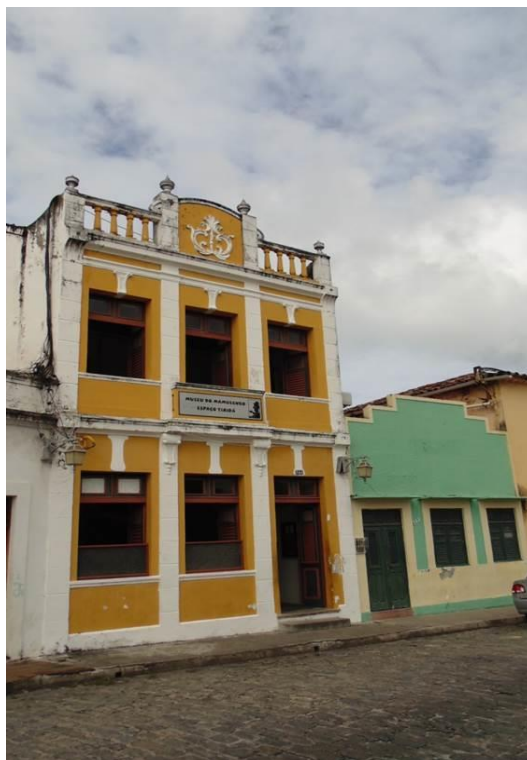
Figura 13. Fachada da atual Sede do Museu do Mamulengo.