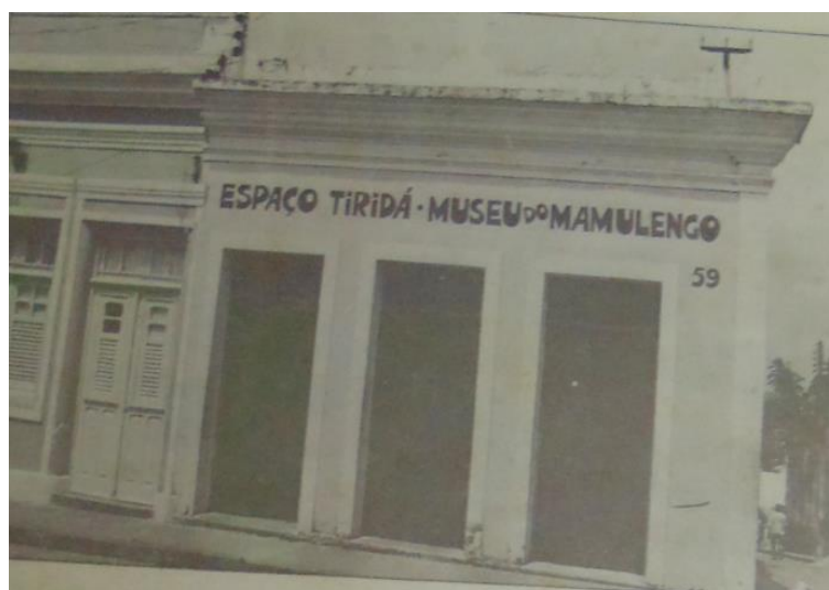
Figura 12. Fachada da primeira Sede do Museu do Mamulengo.