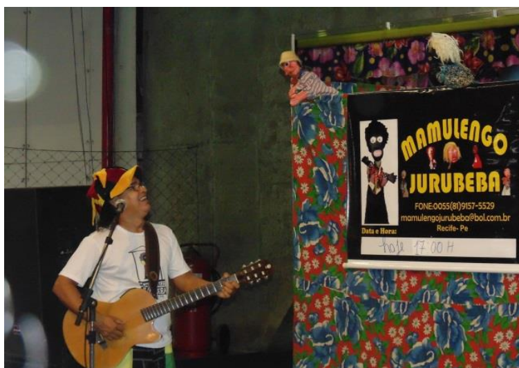
Figura 3. Músico no Mamulengo Jurubeba. Apresentação realizada durante a XV Feira Nacional de Artesanato – FENEARTE.

Por meio da análise das imagens identificamos a diversidade de instrumentos utilizados pelos músicos durante os espetáculos. Na Figura 2 identificamos a presença de três músicos, cujos instrumentos fazem parte da estrutura do forró pé de serra (sanfona, triângulo). A diferença existente entre os dois grupos diz respeito ao instrumento de percussão. No Mamulengo de João Galego é usada uma caixa, enquanto no Mamulengo de Zé Lopes o instrumento utilizado foi o ganzá. Em relação a figura 3 verificamos a presença de um único músico que assume o vocal e o violão. Nela é possível identificar, pelo direcionamento do olhar do músico e dos bonecos, o exato momento do diálogo entre eles.