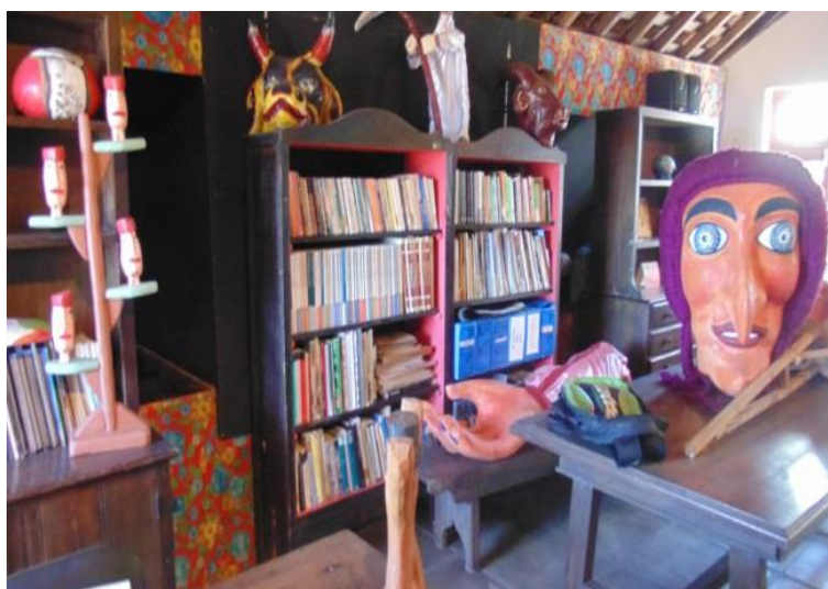
Figura 14. Parte do acervo bibliográfico do Museu do Mamulengo.