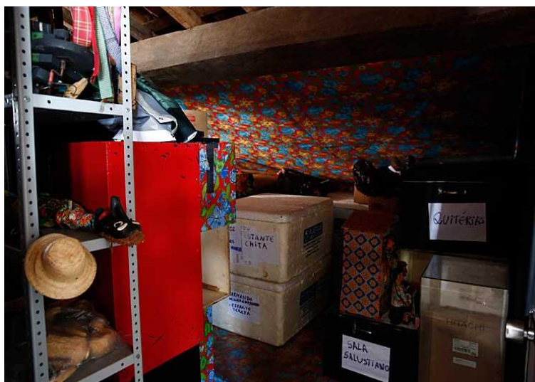
Figura 15. Acondicionamento do acervo do Museu do Mamulengo

Em relação ao acervo proveniente da Coleção Fernando Augusto Gonçalves – Museu do Mamulengo, como já mencionado anteriormente, foi transferido em definitivo para as dependências do Museu do Mamulengo no ano de 2015. A ausência de uma reserva técnica para acondicioná-lo corretamente na nova sede como pode ser observado na imagem da matéria “Mamulengo entre a celebração e o descaso” produzida pelo JC online do dia 01/06/2016.